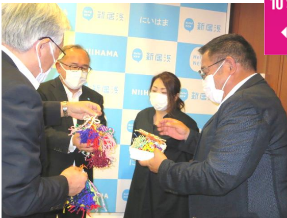
愛媛県人権対策協議会新居浜支部様より