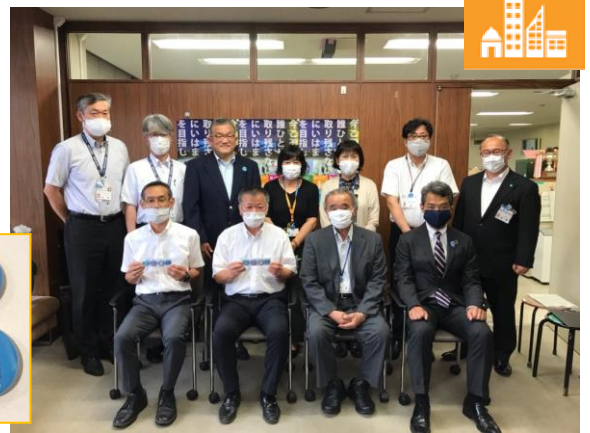
新居浜美術館&新居浜ユネスコ協会様より