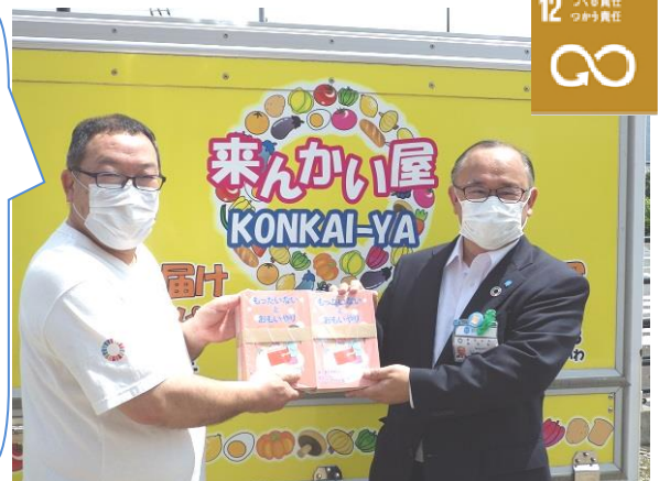
冊子『もったいないとおもいやり』