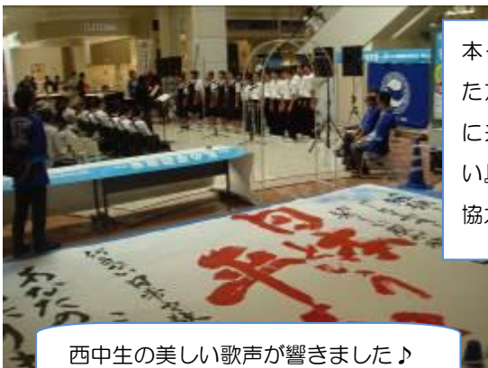
西中生の美しい歌声が響きました♪

本イベントを観覧してくださった方々やイオンモールに買い物にいられた方々に『平和への思い』を書いていただきました。ご協力ありがとうございました。