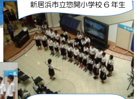
惣開小の日本のみならず世界に発信する平和への思いが、聞く人見る人の心を打ちました。

『あなたの当たり前は あたりのまじじゃない！』 何気ない日常の中は、本 当に多くの幸せがあら れています。その心に響 き、未来へ繋ぎましょう。