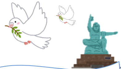
新居浜市立惣開小学校6年生