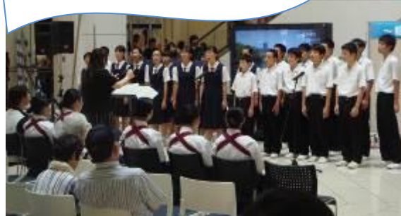
新居浜市立西中学校合唱部

『あなたの当たり前は あたりのまじじゃない！』 何気ない日常の中は、本 当に多くの幸せがあら れています。その心に響 き、未来へ繋ぎましょう。