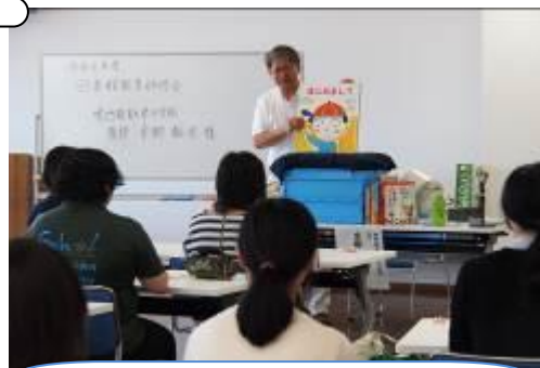
愛されるキャラクターは丸い形!