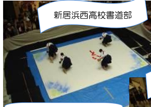
新居浜西高校書道部