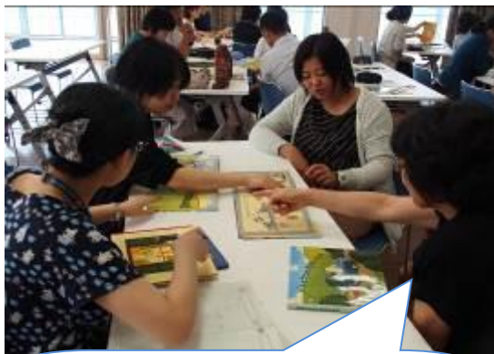
絵本に隠された秘密がそこに! 意図的に仕掛けられた秘密がたくさん!

実際に参加者全員が絵本を変えながら、グループごとに読み聞かせを行いました。声色を変えたり、強弱をつけたり、絶妙に間を空けたりと聞いている人を絵本の世界へと引き込むたくさんの工夫が見られました。さすがは伝えることを仕事としている先生方です。みなさん聞くことにも夢中です!