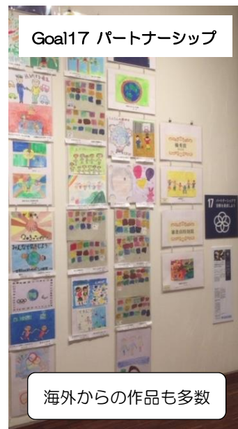
Goal17 パートナーシップ