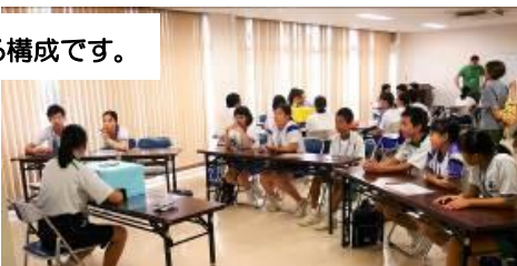
ALTの先生方が企画した授業です。