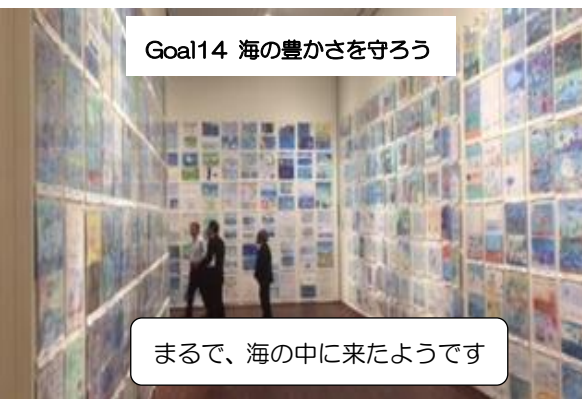
Goal14 海の豊かさを守ろう