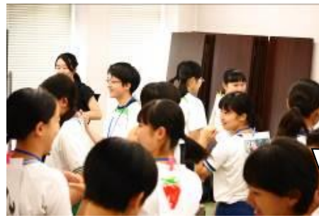
日本語は禁止です。

大学生企画の授業です。教員希望だけあって、大学でよく勉強されています。これは、自分の背中に書かれている絵を、他者に英語で質問しながら当てる活動です。果物、野菜、動物の絵が描かれています。