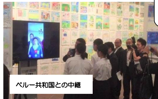
ペルー共和国との中継