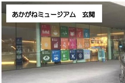
あかがねミュージアム 玄関